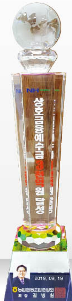
「상호금융예수금 3천억원 달성탑」 수상