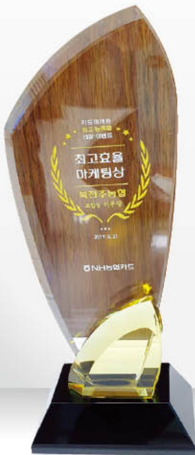
NH카드 25주년 「카드마케팅 최고 농협」 선발이벤트 그룹 1위